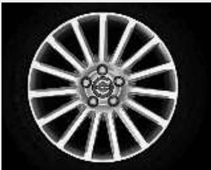
Regor 7,0 x 17"