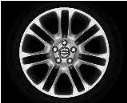
Zubra 8,0 x 18"