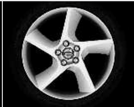
Odysseus 8,0 x 18"