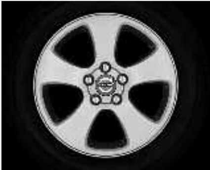
Creon 7,0 x 16"