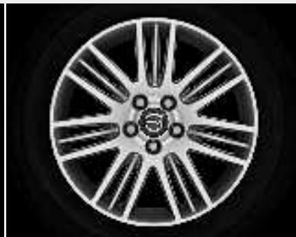
Meissa 8,0 x 17"