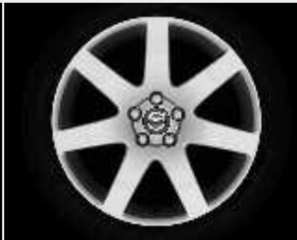
Venator 8,0 x 18"