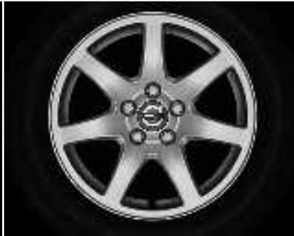
Naos 7,0 x 16"