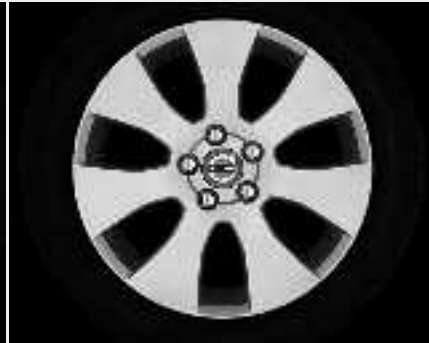
Spartes 7,0 x 17"