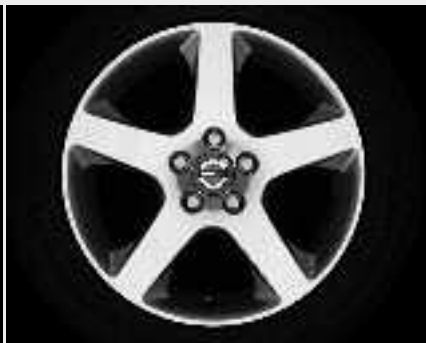
Canicula 7,0 x 17"